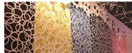
「DROP PAPER」新色として3種類の蛍光色加わり、カラーバリエーションがさらに充実。規格サイズが巾2400mmで、迫力のあるディスプレイを創出。(株)バック

「DROP PAPER」はガラス繊維を含有する不織布の紙素材。紙の持つ軽さや風合いはそのままに、カールやヨレがほとんどなく、防火性能も持つ新しい内装素材だ。植物由来のセルロースを主成分としており、環境にもやさしい。