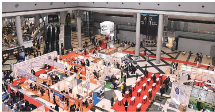
健康寿命延伸産業のビジネス展示会「健康博覧会」(1/31~2/2@東京ビッグサイト)の会場にもざわめきが響く

FINANCIAL TIMES 誌は1月17日(ロンドン時間)、InformaがUBMを買収し、英国に上場しているコンベンション・ビジネス情報サービス事業者を集め、市場価値が90億ポンド以上の企業を創出する契約で、UBMを取得するための詳細な協議を行っている」と発表した。1月30日(同)には両者の取締役会がこの提案提携条件を正式に確認。提案内容によると、UBMの価値を約39億ポンドで評価している。