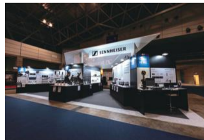
左) USHIO LIGHTING /ライティングフェア 2017 照明だけでなく、さまざまな技術を持った提案ができることをアピールするため、製品展示ではなく製品によって作り出すイメージを展示した 右) SENNHEISER/Inter BEE 2017 壁面グラフィックと製品展示を合わせて展示することで製品の訴求能力をあげた