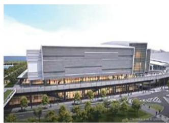
パシフィック横浜ノース施設外観パース図

2020年春開業予定の新 MICE 施設の正式名称は「横浜みなとみらい国際コンベンションセンター」。通称は「パシフィック横浜ノース」となる。新施設には5,000人規模のパーティが可能な多目的ホールを備え、大型 MICE 誘致強化が期待される。