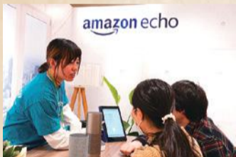
渋谷モディの1階に設けたステージエリア(写真左):ポップアップストアのアクセントはクリスマスツリーやデジタルサイネージのデザインを工夫した。Amazon Echoシリーズのタッチ&トライのコーナー(写真右):会場内の騒音を拾わないようなレイアウトにするなど、各体験ブースの設営・環境にも配慮