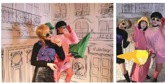
写真左の緑色の小物に注目。右の撮影データでは緑の部分だけ動画が合成されてスマホに届く